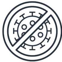
Nipahtáw anihi ká-áhkosískákéki