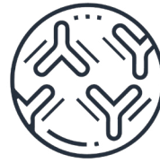
Osihtáw mihkawatoya kita nipahtát áhkosiwin