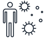
Kiskisi amima áhkosiwin akwa tánsi kita isi mawinéhaman, kisápin kíhtwam kítohtikon.

Kakwécimihkok mino-ayáwi atoskéwak kisáspin awasimé kiwi-kiskénihtén óma ohci oski áhkosiwin cístahikéwin.